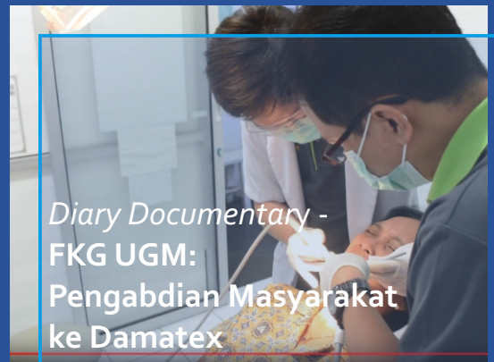
Diary Documentary - FKG UGM: Pengabdian Masyarakat ke Damatex

https://kanalpengetahuan.ugm.ac.id/2018/01/09/pengabdian-masyarakat-fkg-ugm-ke-damatex/